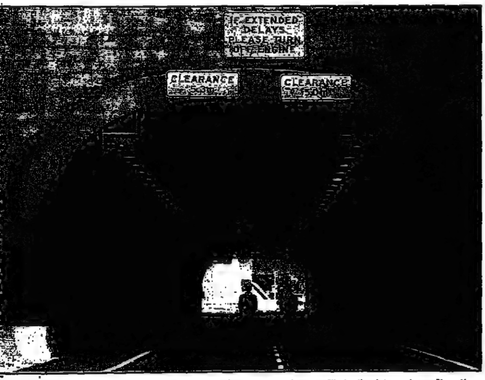
رجلا شرطة يحرسان محل اطلاق الكتيبة في طريق سبيع المتح أس في سبني باستراتيا وكث اكثر من 420 مليون دولار

الدوحة - من كبريا شارما: اعلنت قطر امس الاثنين رسميا سوق اسهم لها بان تشجع المواطنين على الاستثمار فيها بدلا من الاتجاه الى اسواق المال في الغرب. وقال يوسف حسين كمال وكيل وزارة المالية انه يتوقع ان تشجع البورصة المواطنين القطريين على الاستثمار في مشروعات القطاع العام والخاص والحد من هجرة رؤوس الأموال القطرية الى الخارج. وكان كمال يتحدث بعد ان افتتح الشيخ محمد بن خليفة آل ثاني وزير المالية والاقتصاد والتجارة سوق قطر للاوراق المالية. وتحاول قطر فتحها مثل باقي الدول